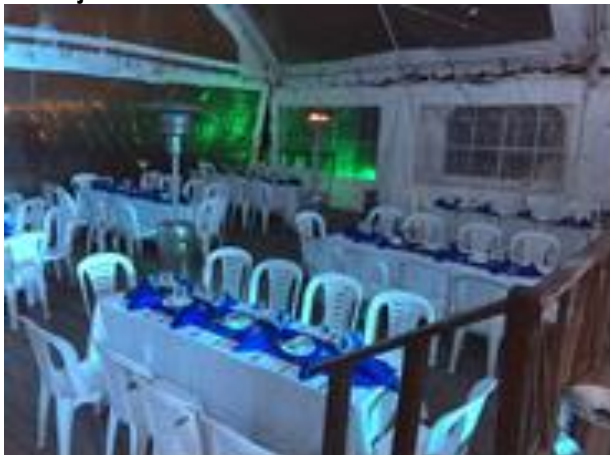
Montaje especial en exterior - Terrazas