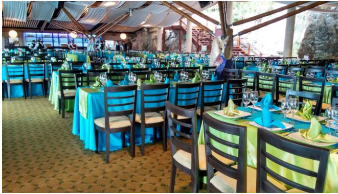
Montaje Salón Cascadas