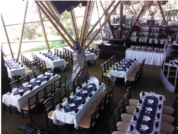
Montaje Salón Terrazas